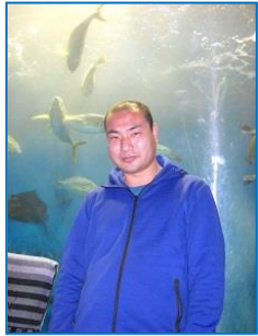
なかなかうっとり♡