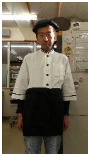
どっちもベリーキュート！